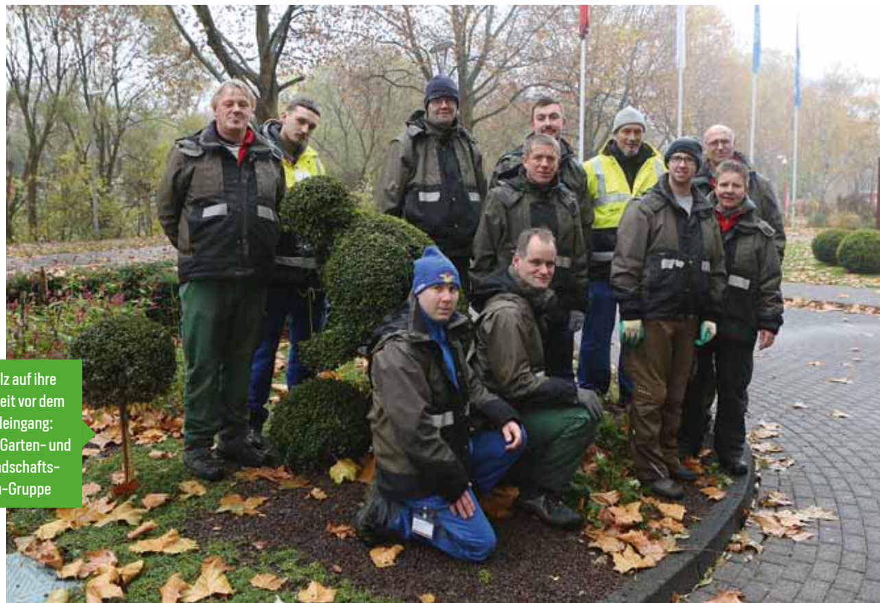
Stolz auf ihre Arbeit vor dem Südeingang: die Garten- und Landschaftsbau-Gruppe