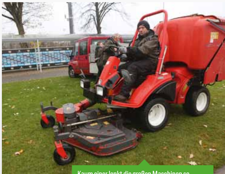
Kaum einer lenkt die großen Maschinen so geschickt bis in die kleinste Ecke.