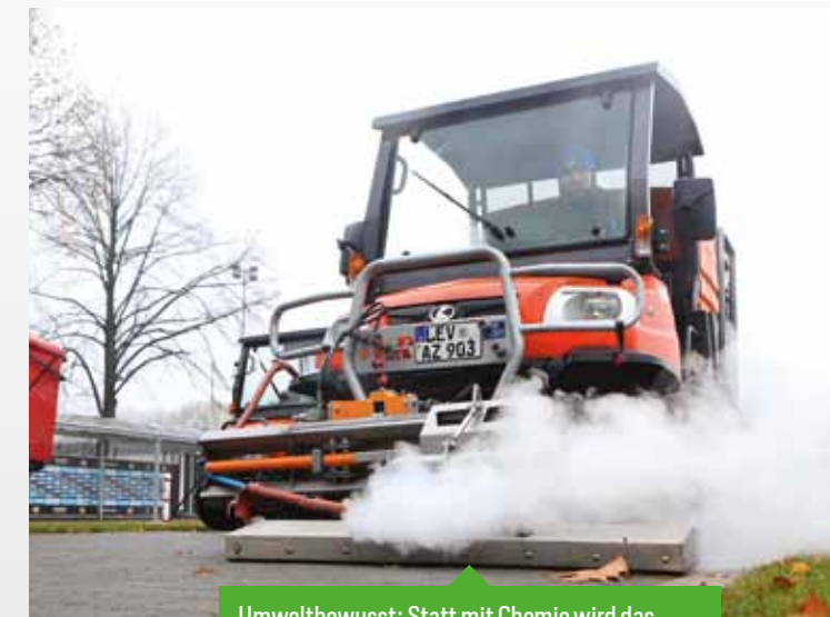
Umweltbewusst: Statt mit Chemie wird das Unkraut mit einer Dampftechnik vernichtet.